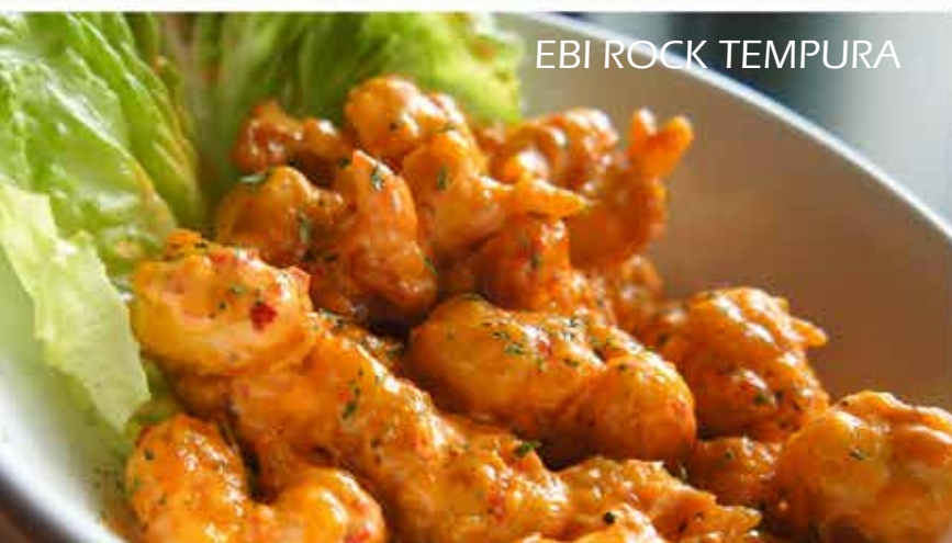
EBI ROCK TEMPURA