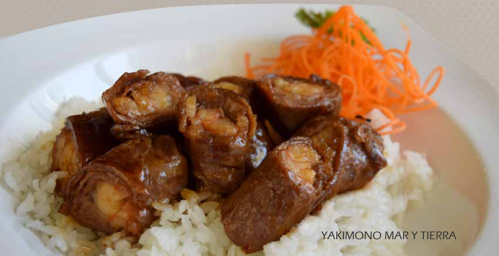
YAKIMONO MAR Y TIERRA