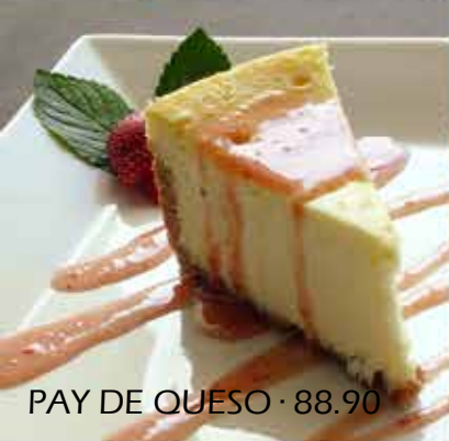
PAY DE QUESO · 88.90