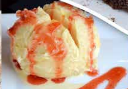
TEMPURA HELADO · 74.90