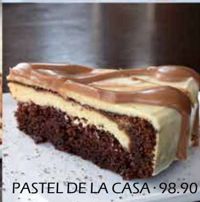
PASTEL DE LA CASA · 98.90