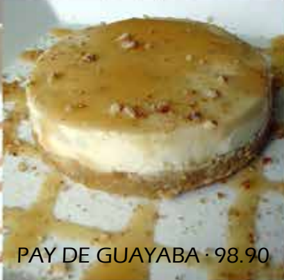
PAY DE GUAYABA · 98.90