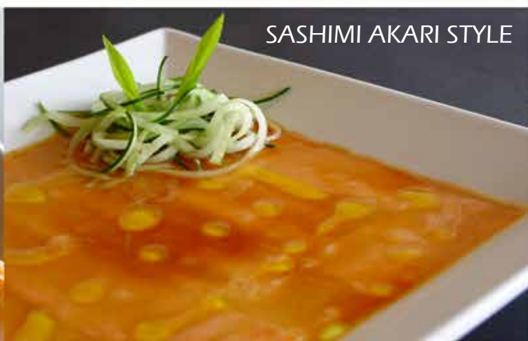
SASHIMI AKARI STYLE