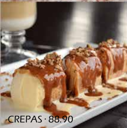
CREPAS · 88.90