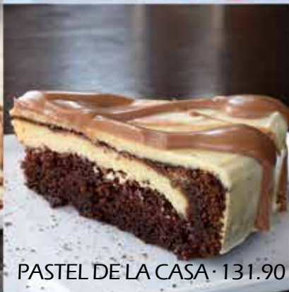
PASTEL DE LA CASA · 131.90