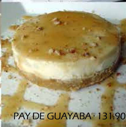
PAY DE GUAYABA · 131.90