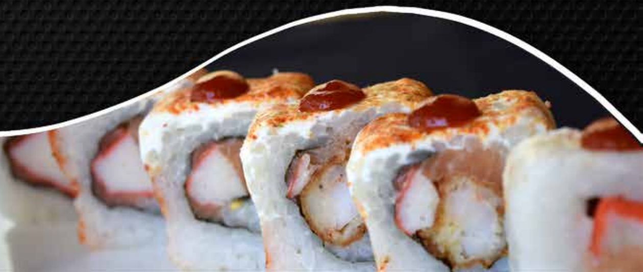
BIG BANG ROLL

CAMARÓN, AGUACATE Y FILADELFIA CUBIERTO CON ANGUILA, SALSA DE ANGUILA Y AJONJOLÍ.