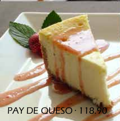
PAY DE QUESO · 118.90