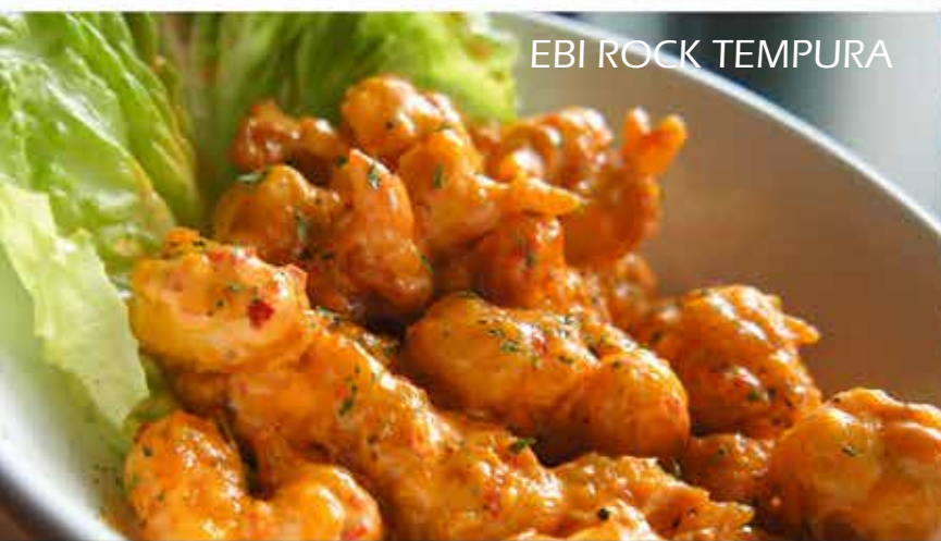
EBI ROCK TEMPURA