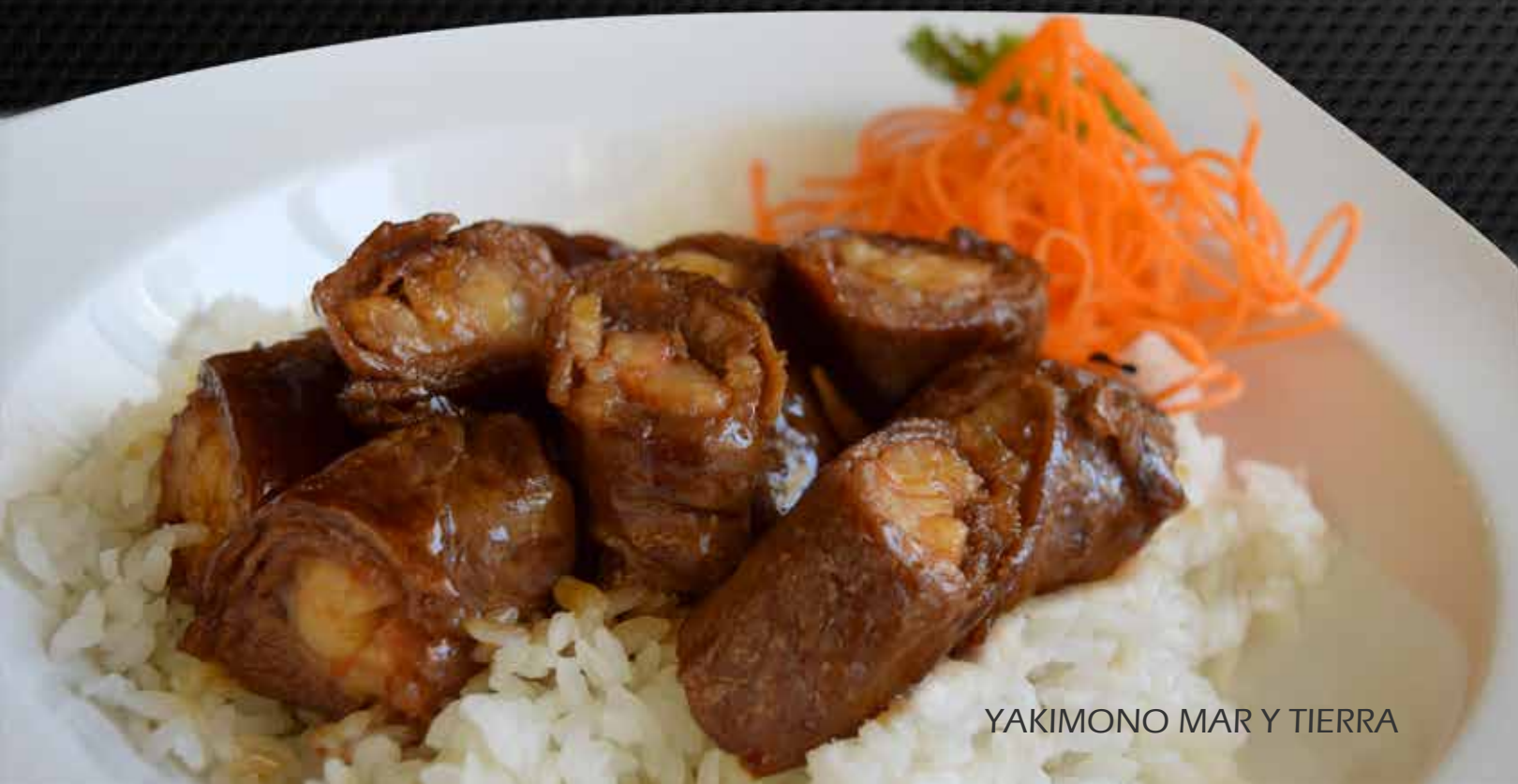
YAKIMONO MAR Y TIERRA