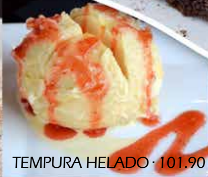
TEMPURA HELADO · 101.90