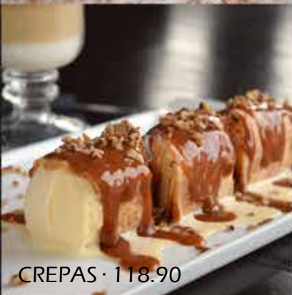
CREPAS · 118.90