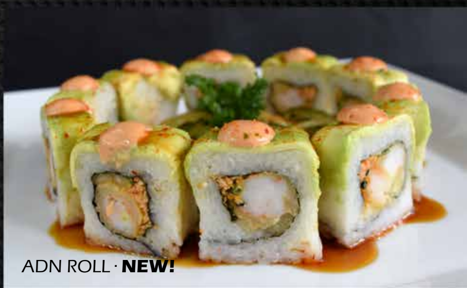
ADN ROLL · NEW!