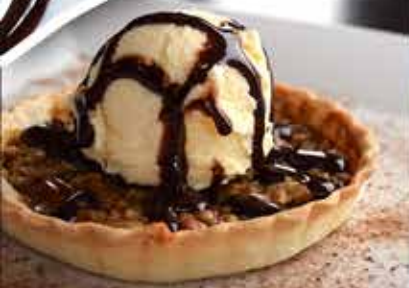
PAY DE NUEZ · 146.90