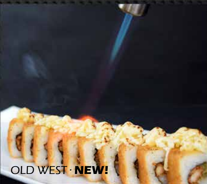
OLD WEST · NEW!

Pulpo, camarón, aguacate cubierto con manchego y empanizado con tampico y chipotle