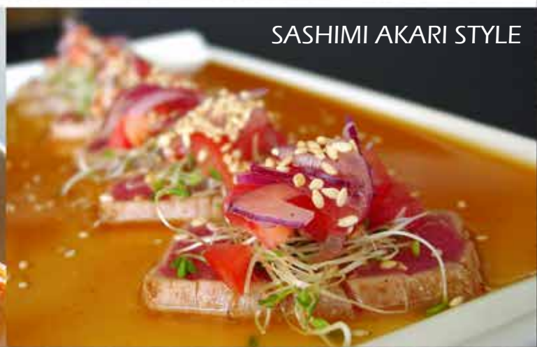
SASHIMI AKARI STYLE